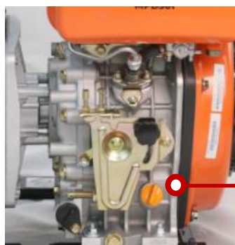
Заливная пробка с масляным щупом