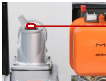
Заливная горловина. Перед первым пуском достаточно залить воду в корпус мотопомпы, воздух во всасывающем шланге она прокачает сама.