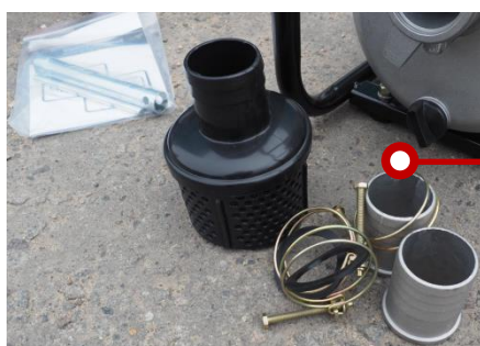
Мотопомпы укомплектованы фильтр-сеткой, переходниками, хомутами для крепления шлангов.